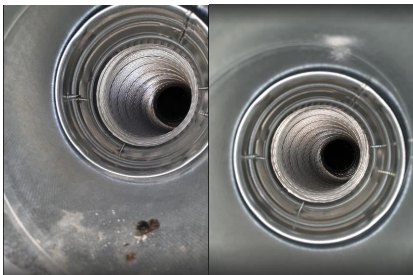
Etter/ til-luft soverom